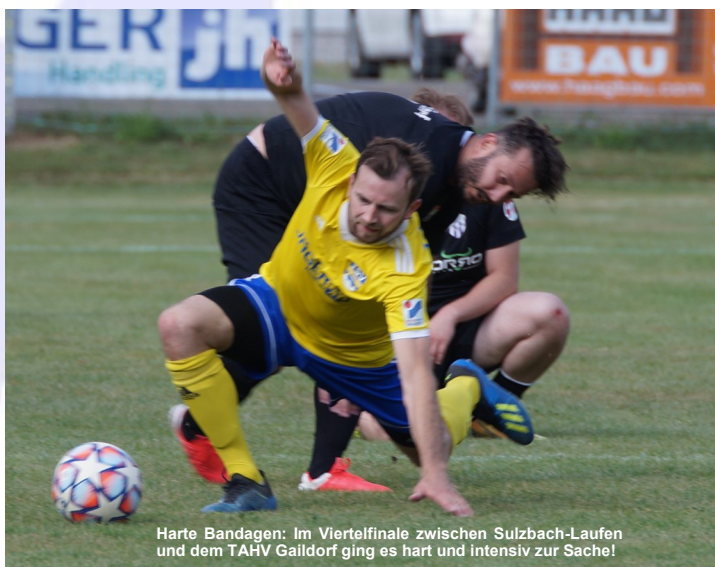
Harte Bandagen: Im Viertelfinale zwischen Sulzbach-Laufen und dem TAHV Gaildorf ging es hart und intensiv zur Sache!